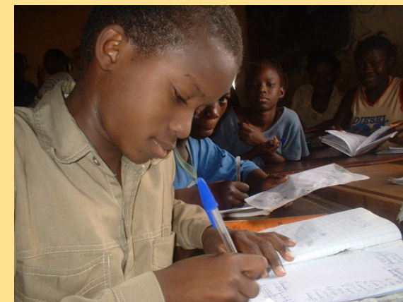
Bamako, Mali – Mars 2005