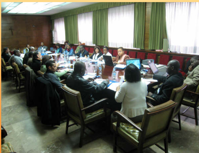
Madrid, Espagne – janvier 2008

Neuf équipes nationales constituées de responsables du curriculum, de la planification, de l'inspection et de la formation des enseignants ont été désignées par leurs ministres respectifs. Les équipes de base sont renforcées et élargies selon les thématiques à approfondir. Des experts extérieurs au groupe venant d'Afrique du Sud, de Belgique, du Bénin, du Brésil, de Madagascar, du Portugal, du Rwanda et de la Suisse ainsi que d'autres experts de l'UNESCO ont largement contribué aux débats et au travail au sein du groupe.