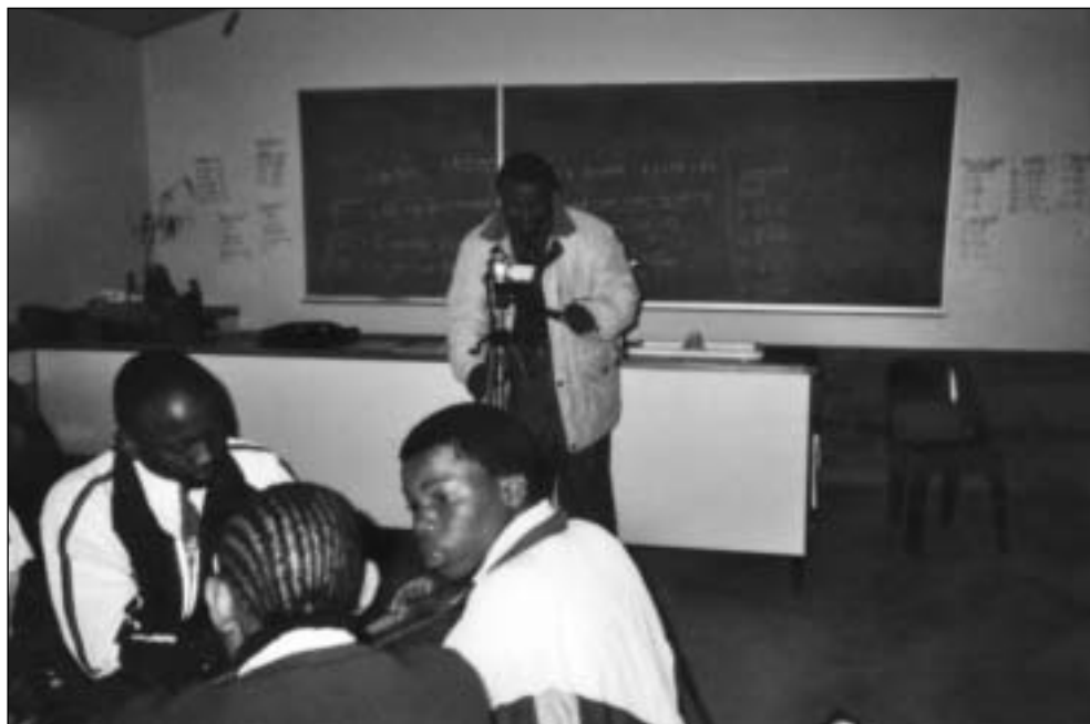
Figura 1. Un docente filma la recreación de una situación en la sala de profesores

En el presente artículo examinamos dos de los vídeos producidos por grupos de docentes: Needy learners y Poverty . ¿Cuáles son las cuestiones candentes que plantean los docentes en el proceso de creación del documental? y ¿cómo arroja luz su producción sobre la importancia de emplazar a los docentes como protagonistas a la hora de abordar la educación inclusiva “desde las bases”?