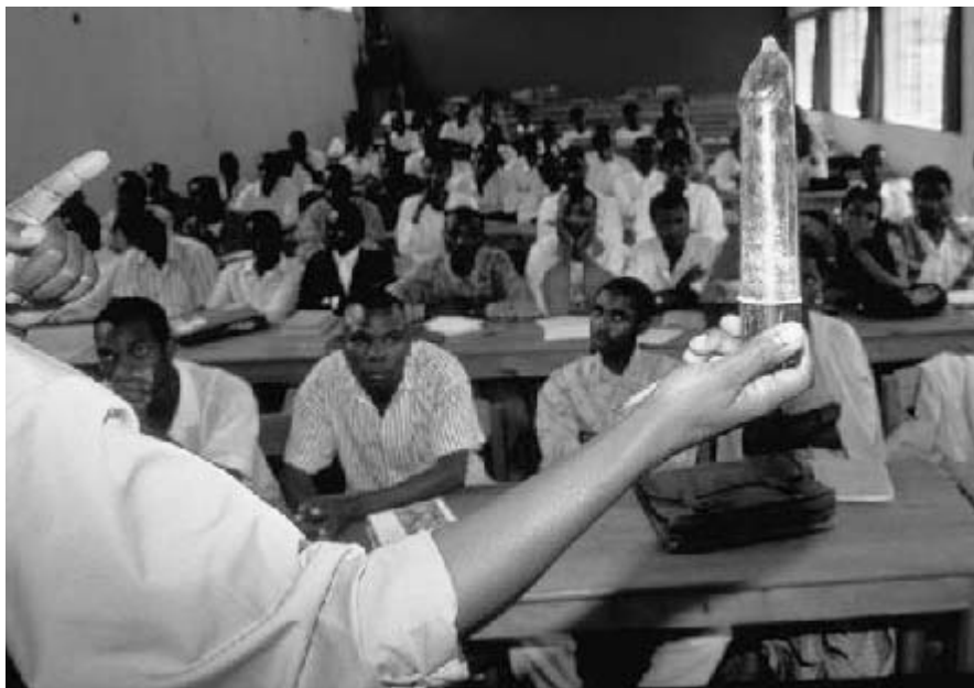
Un membre du groupe local de sensibilisation concernant le SIDA donne des instructions sur l'utilisation des préservatifs aux étudiants adolescents d'une école de Bukavu, Zaïre. Un étudiant fait une remarque : « vous auriez dû nous apprendre cela il y a cinq ans ».

les écoles qui ne possèdent pas de programmes de santé efficaces, dans les régions où l'incidence de l'infection est haute et croissante ainsi que dans les lieux ouverts aux jeunes non scolarisés.