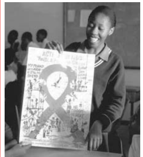
Lesotho. Des étudiants discutent, en classe, des matériels sur la prévention concernant le SIDA fournis par des agences de l'ONU et des ONG locales.

Kofi Annan, Secrétaire général des Nations Unies a déclaré que « la première bataille contre la guerre du SIDA, c'est faire tomber le mur du silence et des tabous qui l'entourent ». En fait, des efforts de toute la communauté sont nécessaires au renforcement de l'efficacité du système éducatif en vue d'enseigner le VIH/SIDA à l'école.