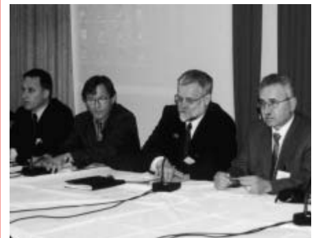
L'ouverture du séminaire de Bohinj.

Pour plus d'informations, veuillez consulter le site web du BIE : http://www.ibe.unesco.org/Regional/SEE/ljubhome.htm