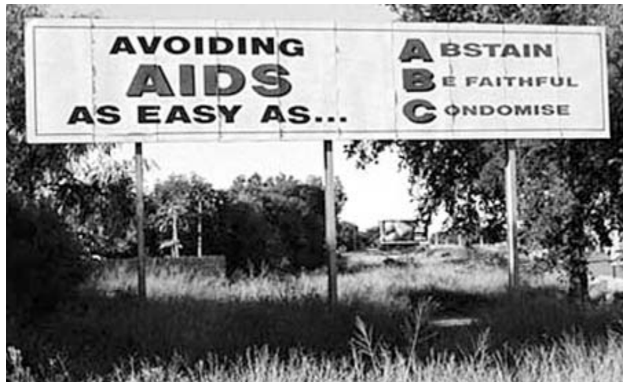
Avertissement sur une route au Botswana.

De plus, étant une maladie sexuellement transmissible, le VIH doit être enseigné dans des contextes sensibles et appropriés au sexe, en tenant compte que 75 % des infections de par le monde proviennent de relations hétérosexuelles non protégées. Les écoles ont souvent tendance à séparer les cours pour les garçons et les filles lorsqu'il s'agit d'éducation sexuelle. Cependant, cette méthode ne devrait pas être suivie lorsqu'il s'agit de l'éducation pour la prévention du SIDA. En fait, un enseignement mixte encouragera garçons et filles à parler entre eux du VIH et de leur sexualité et d'établir ainsi des normes sociales. Les pairs ont le pouvoir d'influencer et d'encourager un comportement positif. Les élèves peuvent s'entraider afin d'avoir un comportement plus sain, plus positif, comme par exemple, refuser les relations sexuelles, l'utilisation abusive d'alcool et encourager l'utilisation des préservatifs.