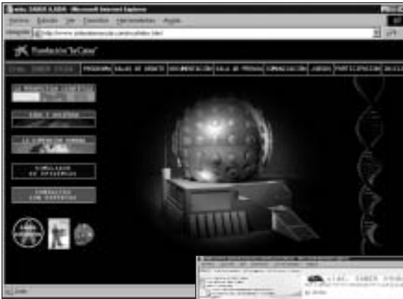
FIGURA 4. Página inicial de la web: sidasaberayuda.com

El principal objetivo en el terreno de las nuevas tecnologías es, en este programa, la posibilidad de crear comunidades virtuales de estudiantes y profesores. Comunidades que se planteen aprender juntos, discutir los diferentes temas de estudio, intercambiar trabajos y otras actividades académicas. La actividad educativa y formativa debe saltar los muros de la escuela para salir al entorno social. Actualmente, ese entorno es también virtual, que pone en contacto a personas alejadas físicamente, pero que pueden estar muy próximas y relacionadas en función de unos intereses comunes. Nada mejor que la red para conseguir la creación de una amplia comunidad (léase comunidades) de aprendizaje. Por ello, es necesario crear un espacio escolar, en el que se preserve a los estudiantes del maremágnum que, hoy en día, constituyen los lugares de visita y encuentro para jóvenes. SIDA Saber Ayuda tiene hoy como objetivo crear una comunidad virtual de aprendizaje en torno a este tema.