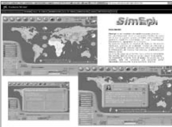
FIGURA 7. Pantallas del juego on line: Simulador de Epidemias: SIMEPI

Uno de los elementos que más motivación produce es un juego on line, "SIMEPI", en que se plantea a los alumnos pilotar el transcurso de la epidemia durante una serie de años. Es un juego de simulación y de estrategia, en el que el alumnado decide los recursos, las acciones y las campañas que va a destinar a cada continente.