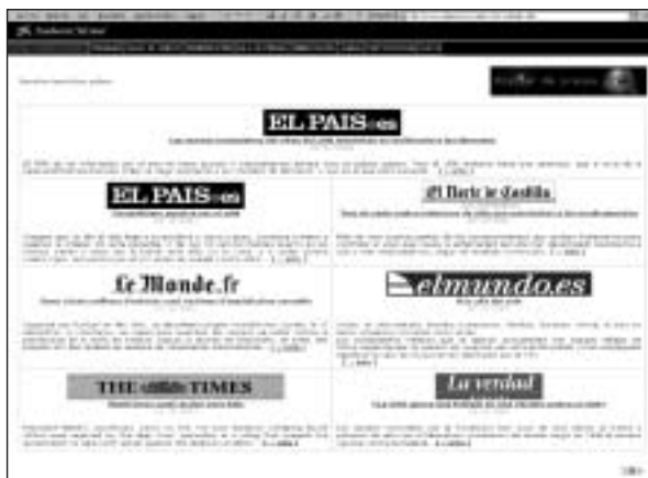
FIGURA 6. Uno de los resúmenes de prensa. Al marcar la noticia aparece el texto íntegro extraído del periódico.

Además de la documentación, cada quince días se actualiza un dossier de prensa escrita para que el alumnado pueda comprobar la vigencia mediática de esta cuestión. Aparecen noticias de diarios en diversas lenguas, con lo que el profesorado de idiomas extranjeros puede trabajar también. Junto con las canciones que contiene la web, el aprendizaje de lenguas de forma integrada en el proyecto. (Vid. Fig. 4)