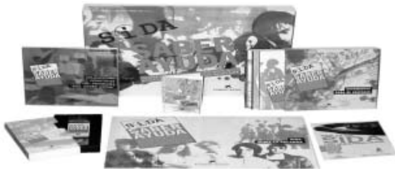
Figura 2. Materiales del Programa

Parte fundamental de esta cuarta fase, fue la realización de dos investigaciones para evaluar el funcionamiento del Programa, si bien estas no fueron los únicos elementos evaluadores. Hay que añadir, que el año de contactos entre el equipo de diseño y el profesorado de los centros educativos, el trabajo con alumnos y profesores para preparar el Forum citado, los informes que recibimos de los asesores de muchos CEP (Centros de formación permanente de profesorado), y otro tipo de acciones (premios de innovación, de guiones de video, de carteles etc.) ofrecieron una información muy valiosa. Probablemente, pocos proyectos innovadores de estas dimensiones han tenido un esfuerzo tan grande de seguimiento y evaluación.