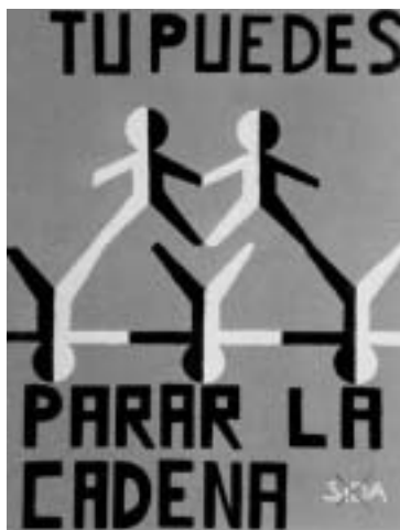
Figura 3. poster realizado por jóvenes participantes del Programa SIDA Saber Ayuda.

Respecto a la dinámica que debía producirse en los centros docentes, el Programa que se propuso debía facilitar la alteración positiva de la rutina diaria, provocar espacios de discusión nuevos y propiciar una visión de saber que no fuese excesivamente académica. La concurrencia de las diversas áreas curriculares en torno a la solución de preguntas, que deben ser desveladas con toda la riqueza de conocimientos científicos y culturales, produce no un festejo o una actividad cultural más, sino la posibilidad de trabajar con toda potencia y profundidad un problema social que permite incorporar todo tipo de contenidos conceptuales, así como métodos y técnicas de trabajo de las diferentes disciplinas escolares.