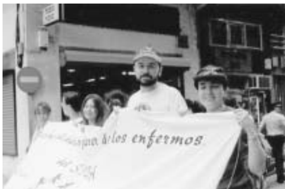
Figura 7. Marcha solidaria en favor de los enfermos de SIDA.

Potenciar las actividades de tipo literario, dramático y epistolar entre el alumnado, como medio de expresión de sus inquietudes, opiniones y deseos de dar solución a un problema social como el SIDA.