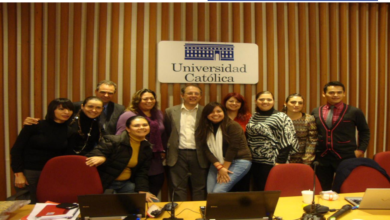
Los participantes del Diploma de las Promociones 2010-12 opinan: